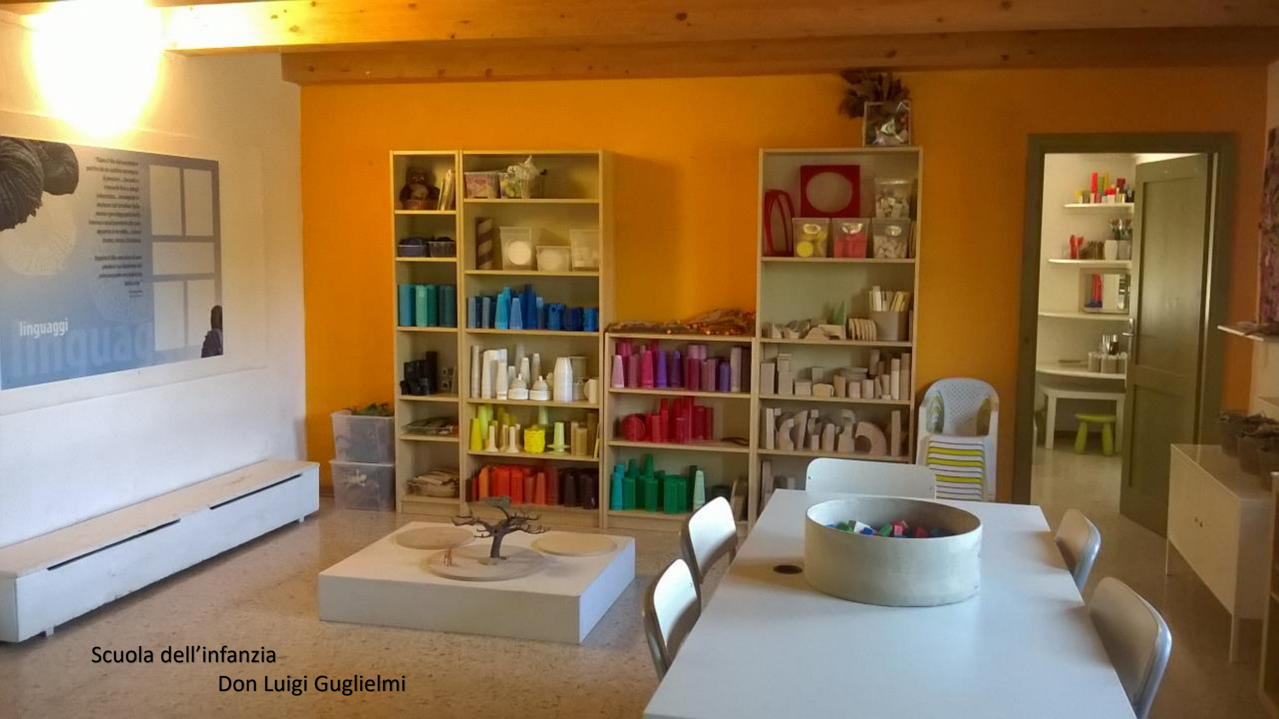
Scuola dell'infanzia Don Luigi Guglielmi